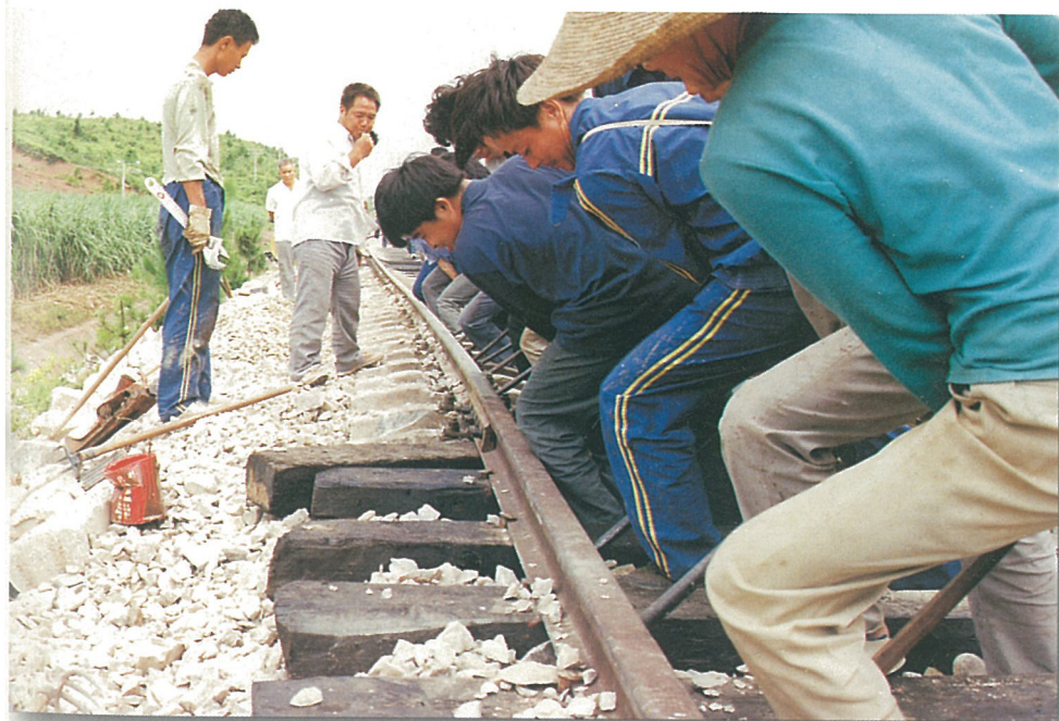
● 广西地方铁路的建设者奋战在新建设工地上。