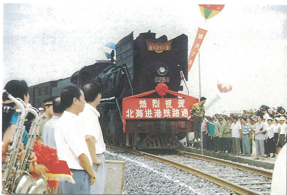
● 1996年7月1日,北海进港铁路建成通车。