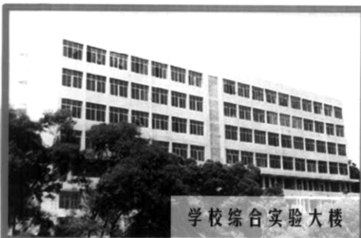
学校综合实验大楼