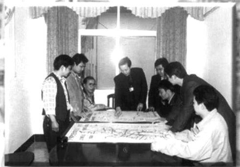
市建设局领导班子在研究工作

七、城市燃气逐步规范管理。近年来，该市组织公安消防、劳动安全、城建等部门对我市燃气业进行了6次专项检查，对各经营点实行经营许可证制度，保证了我市至今未出现任何燃气安全事故。