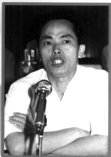
自治区主席李兆焯视察学校工作时讲话

百色民族工业中等专业学校，是一所经自治区人民政府批准创立的全日制、综合性公办普通中专学校。学校坐落在红七军的故乡——百色市。校园环境幽雅，空气清新，是学习、生活的理想场所。学校建筑面积近2万平方米，有宽敞舒适、设施齐全的教学楼、实验楼、图书楼，公寓式学生宿舍以及必备的体育运动场所。教学设备先进，有仪器精良的分析实验室、电脑室、语音室、财会模拟室、电工实验室、机电机械实验室和机电实习车间、食品工程实验工厂等。学校师资力量雄厚，现有专职教师53人，其中高中级职称35人，双师型教师8人。去年自治区教育厅对中等职业技术学校进行办学基本条件评估，确定我校办学基本条件合格。