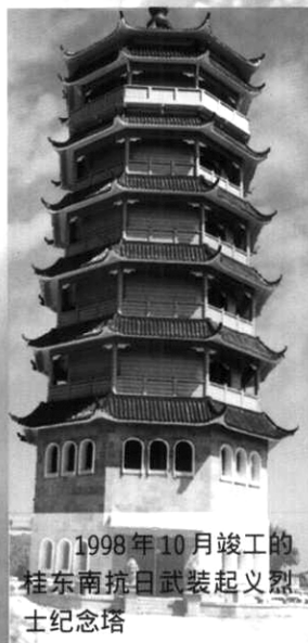
1998年10月竣工的桂东南抗日武装起义烈士纪念碑